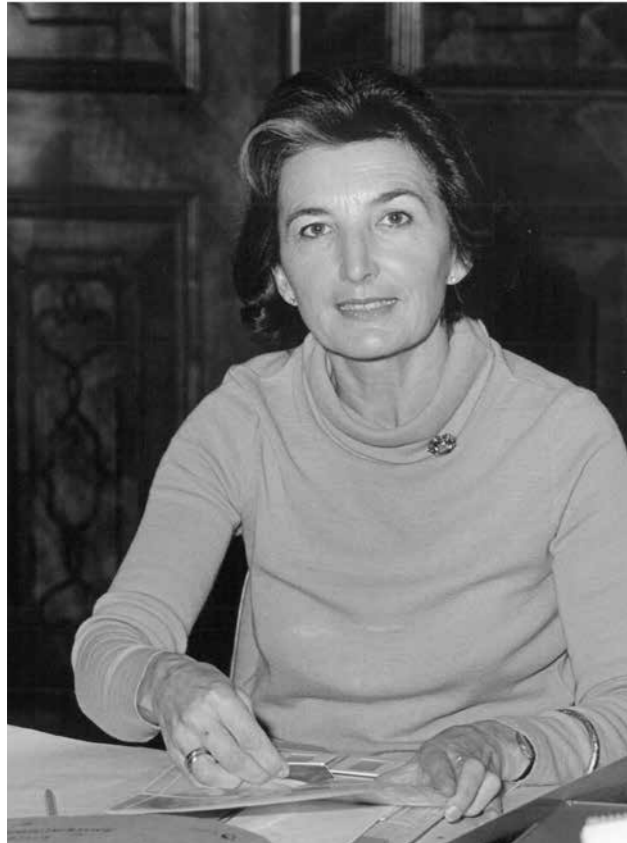
Abb 5: Elisabeth Reichmann