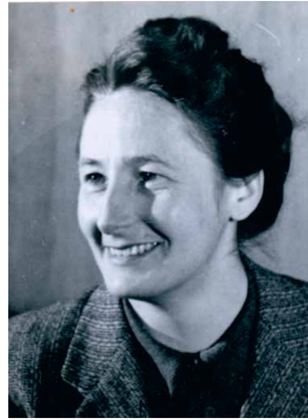
Abb 4: Johanna Gritsch

Die wohl wichtigste Rolle als Kunsthistorikerin in der Inventarisierung und Denkmalforschung in Österreich stellt Eva Frodl-Kraft (1916-2011) dar. 11 Sie studierte Kunstgeschichte und Geschichte an der Universität Wien und promovierte 1939 mit einer Dissertation über die