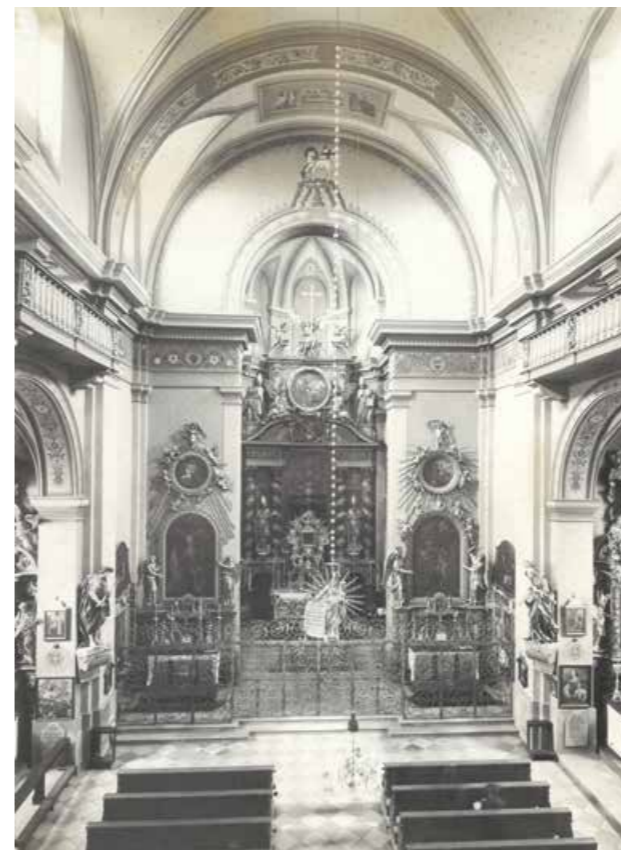
Abb 6: Wallfahrtskirche Maria Plain vor der Restaurierung

Die Salzburger Dreifaltigkeitskirche, nach Plänen von Johann Bernhard Fischer von Erlach errichtet, und