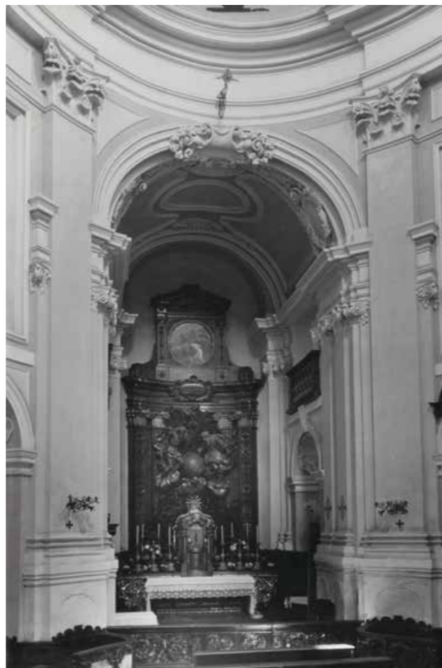
Abb 5: Dreifaltigkeitskirche Salzburg nach der Restaurierung 1948