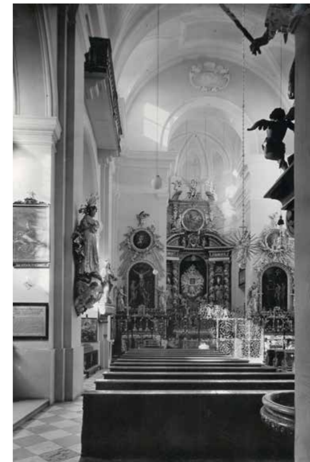
Abb 7: Wallfahrtskirche Maria Plain nach der Restaurierung

Auch in der Wallfahrtskirche Maria Plain verschwanden die Fassungen des 19. Jahrhunderts: Witternigg ließ die dicken braunen Übermalungen der Altäre entfernen – darunter trat eine strahlende, gold-blaue