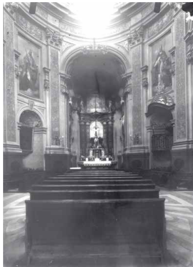
Abb 4: Dreifaltigkeitskirche Salzburg vor der Restaurierung 1947