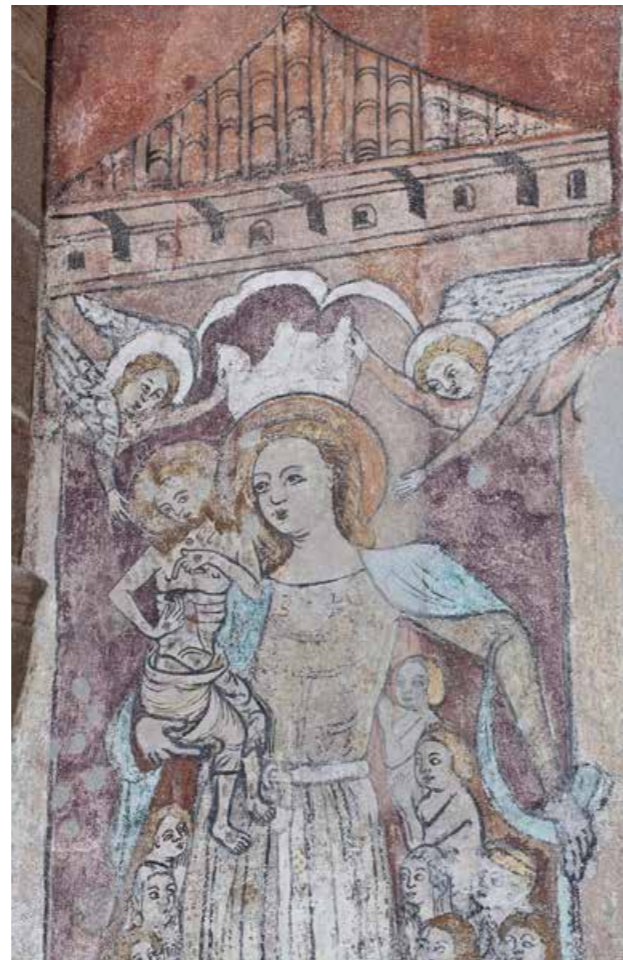
Abb 8: Schutzmantelmadonna von Mariapfarr, 2018

Dass Witternigg nicht nur eine engagierte Denkmal- schützerin, sondern auch eine herausragende Kunst- historikerin war, zeigen ihre Publikationen in der Österreichischen Zeitschrift für Denkmalpflege , der Vor- läuferin der heutigen Österreichischen Zeitschrift für Kunst und Denkmalpflege (ÖZKD). Ein besonderes Herzensan- liegen war für Witternigg die Erforschung mittelalter- licher Wandmalereien. Unter ihrer Aufsicht wurde unter anderem der große Freskenzyklus in der Pfarrkirche von Mariapfarr entdeckt. Dieser Freskenfund wurde von Witternigg 1948 nicht nur publiziert, sondern regel- recht zur Diskussion gestellt: „Einer oberflächlichen Be- trachtung mag diese Schutzmantelmadonna als eine jener im 14. und 15. Jahrhundert recht gebräuchlichen [...] Dar- stellungen [...] erscheinen. Aber etwas viel merkwürdigeres und durchaus Einzigartiges ist gegeben: Auf ihrem rechten Arm hält die Himmelskönigin nicht das Jesukind, sondern einen kindhaft klein gebildeten Schmerzens- mann. Es handelt sich hier um eine vielleicht einmalige Verschmelzung zweier Darstellungen aus dem Gedanken- kreis der Fürbitte [...]. Die Verquickung der beiden Motive der Schutzmantelmadonna und des Schmerzensmannes zu einem Komplex ist bisher nicht nachzuweisen. Ob es sich da um eine Erfindung des Malers selbst handelt oder ob wenigstens literarische Vorbilder Pate gestanden sind, wird sich erst nach eingehendem Studium [...] entscheiden